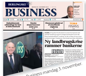
Berlingske Business mandag 3. november.

Landbruget benytter de faldende priser og forværrede situation på verdensmarkedet til at ønske sig bedre rammebetingelser hos politikerne.